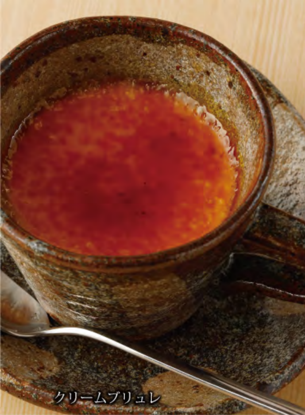
クリームブリュレ