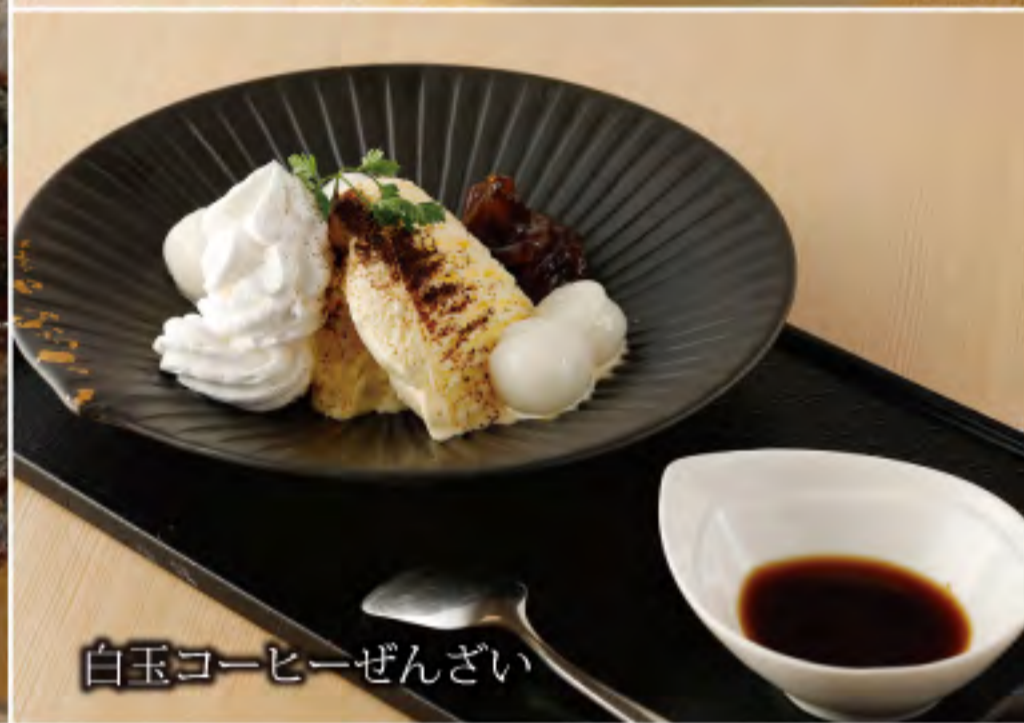
白玉コーヒージェンザイ