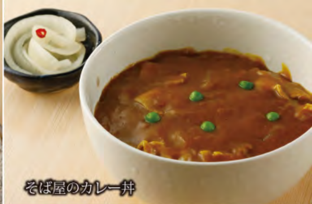
そば屋のカレー丼