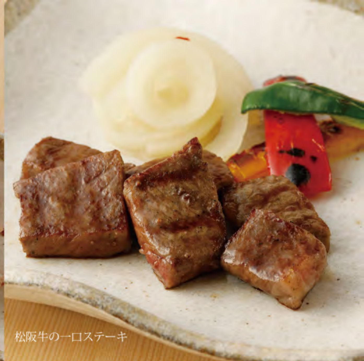
松阪牛の一口ステーキ