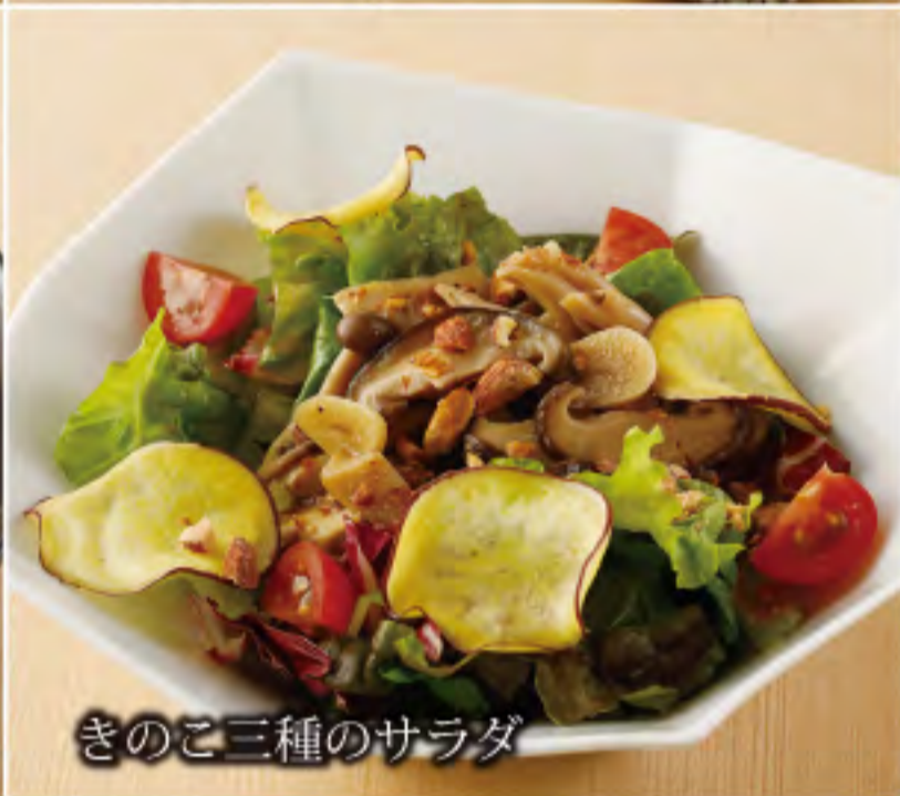
きのこ三種のサラダ