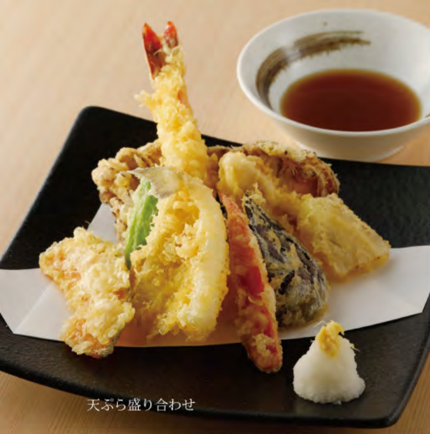
天ぷら盛り合わせ