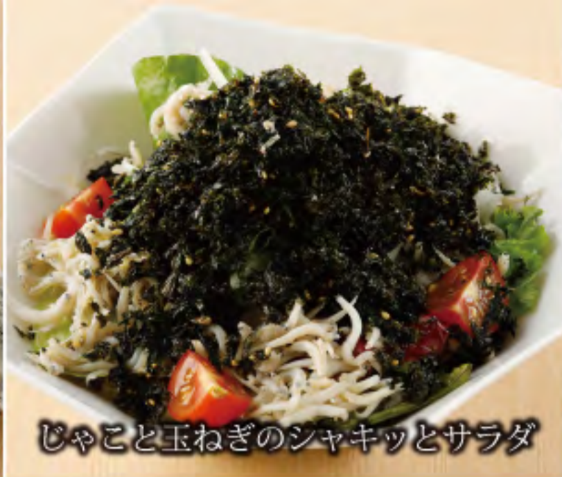
じゃこと玉ねぎのジャキツとサラダ