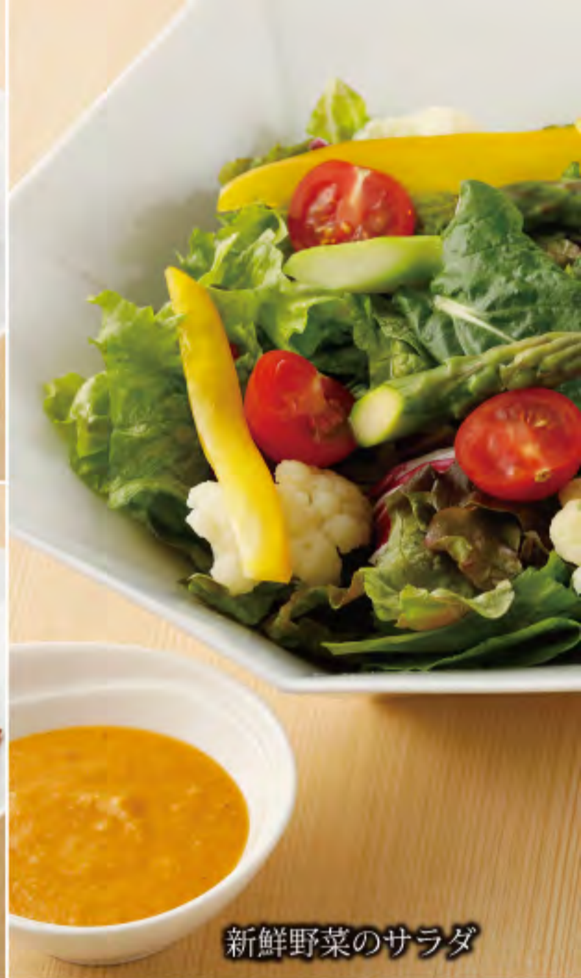
新鮮野菜のサラダ