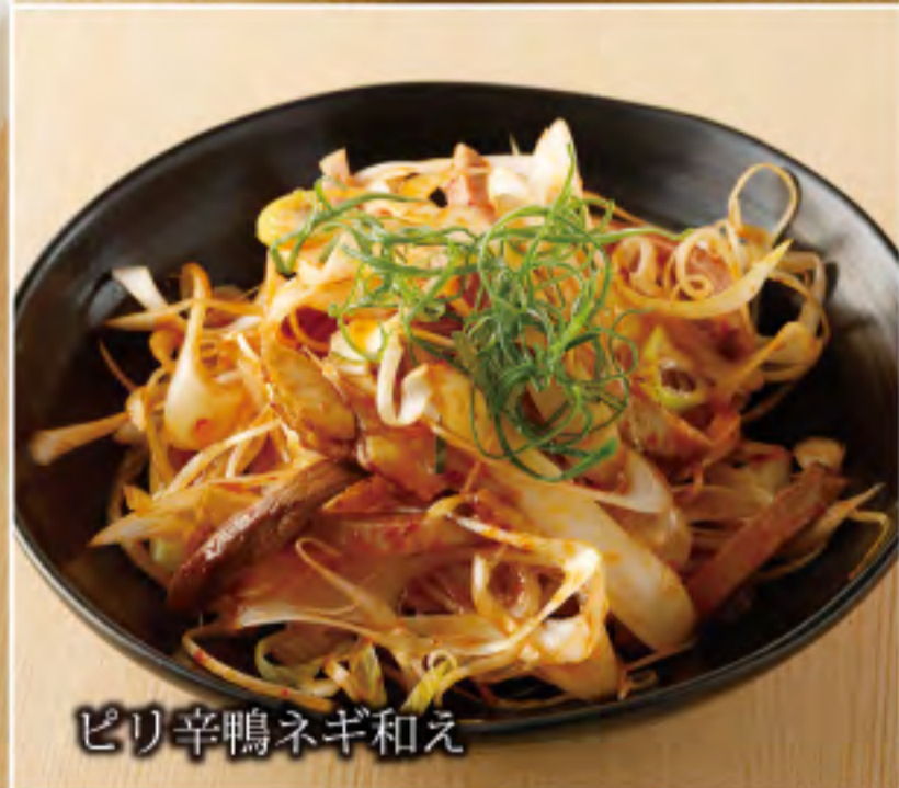
ピリ辛鴨ネギ和え