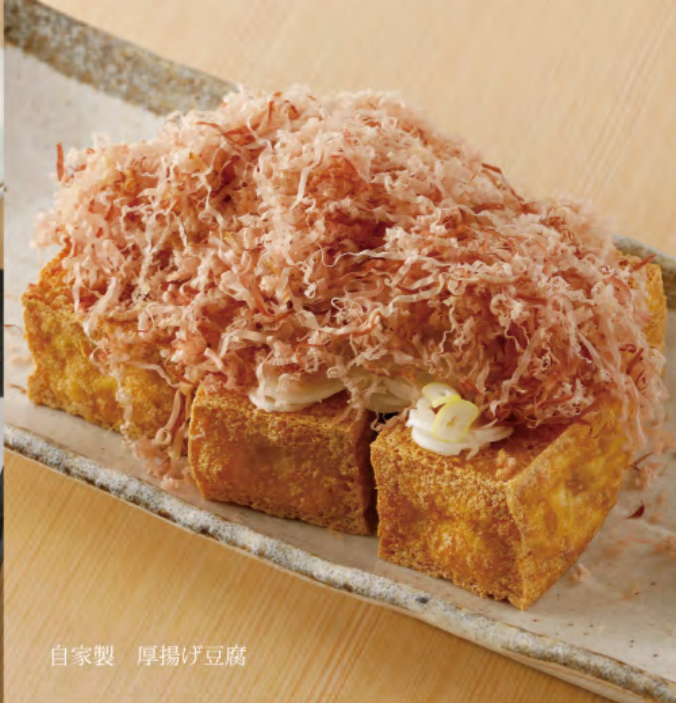
自家製 厚揚げ豆腐