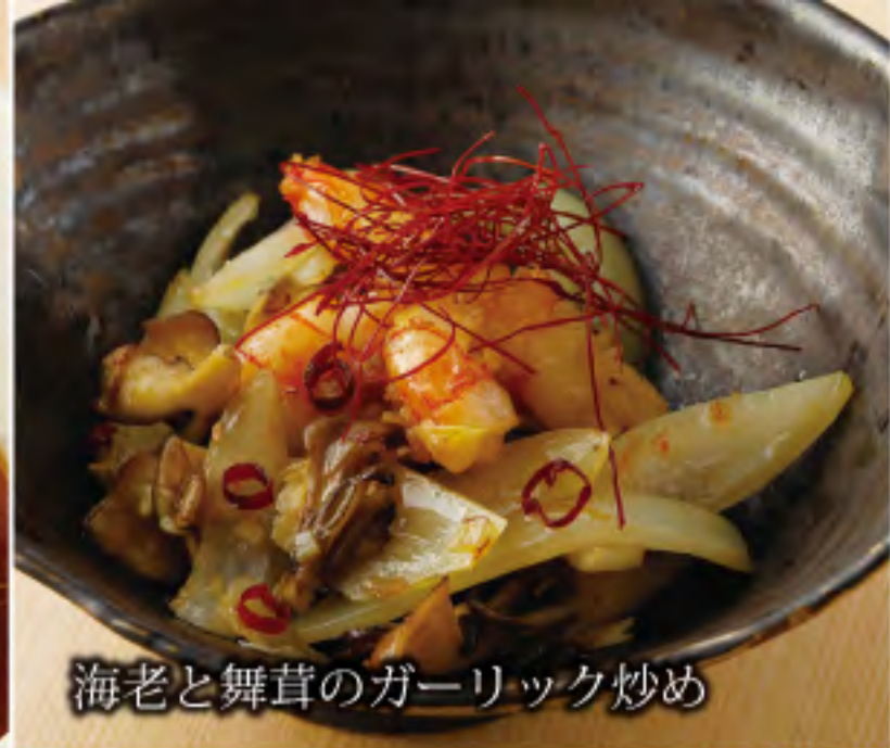
海老と舞茸のガーリック炒め